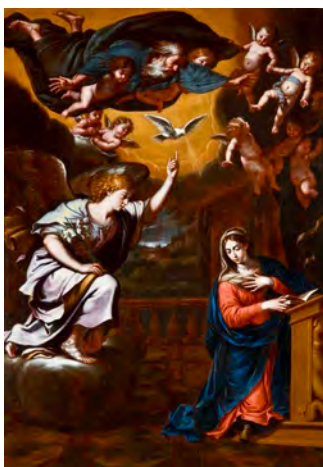
Stefano Erardi, „Zwiastowanie Dziewicy”, Mдина, Malta, fot. Daniel Cilia (za zgodą klasztoru Karmelitów w Mdinie)

Kościół Karmelitów w Mdinie powstał w latach 1660–1675; jest to świątynia pod wezwaniem Zwiastowania (ang. Church of the Annunciation). Karmelici obrali Najświętszą Dziewicę za swoją patronkę, a większość kościołów zakonu karmelitańskiego poświęcona jest właśnie Matce Chrystusa.