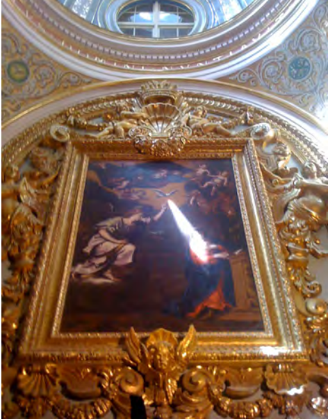
Fenomen światła 25 marca, Mдина, Malta