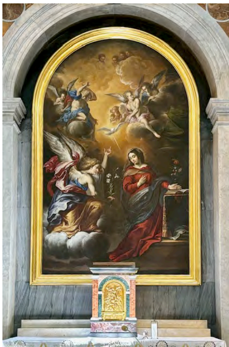
Obraz "Zwiastowanie" w ramie po renowacji w 2024 roku