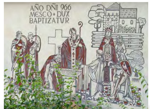
Chrzest Polski, współczesny fresk w Gnieźnie, obok pomnika Bolesława Chrobrego, w pobliżu katedry

„[...] przedstawię resztę czynów znakomitego księcia Polan Mieszka, o którym pisałem szeroko w poprzednich księgach. W czeskiej krainie pojął on za żonę szlachetną siostrę Bolesława Starszego, która okazała się w rzeczywistości taką, jak brzmiało jej imię. Nazywała się bowiem po słowiańsku Dobrawa, co w języku niemieckim wyklada się: dobra. Owa wyznawczyni Chrystusa, widząc swego małżonka pogrążonego w wielorakich błędach pogaństwa, zastanawiała się usilnie nad tym, w jaki sposób mogła by go pozyskać dla swojej wiary. Starła się go zjednać na wszelkie sposoby, nie dla zaspokojenia trzech żądz tego zepsutego świata, lecz dla korzyści wynikających z owej chwalebnej i przez wszystkich