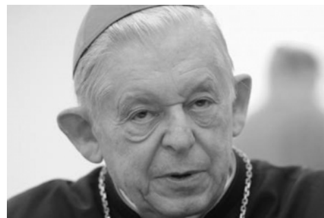
Prymas-senior kard. Józef Glemp.

Kard. Józef Glemp był arcybiskupem metropolitą gnieźnieńskim w latach 1981-1992. Jednocześnie sprawował urząd arcybiskupa metropolity warszawskiego, obie archidiecezje były bowiem do 25 marca 1992 połączone unią personalną. Po reorganizacji struktur Kościoła w Polsce w 1992 i rozłączeniu obu archidiecezji zachował godność Prymasa Polski do 2009 roku jako kustosz relikwii św. Wojciecha. Na mocy decyzji Benedykta XVI tytuł Prymasa Polski wrócił do arcybiskupa metropolity gnieźnieńskiego w grudniu 2009 roku,