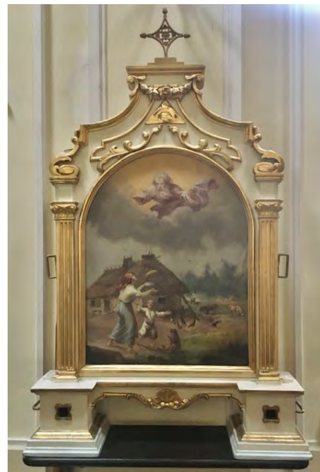
Feretron w prawej Nawie kościoła

Po cóż ten opis? Ano z kilku względów. Widziałem wiele feretronów w kościołach różnych krajów. Jedyny podobny do wilanowskiego charakterem w małym kościółku opodal Halstatu w Austrii. W Polsce drugiego takiego nie ma. Nieliczne są też malarskie przedstawienia Boga Ojca, zaś boską opatrność przedstawia się najczęściej w formie oka wszechwidzącego, umieszczonego w trójkącie z rozchodzącymi się odcieniami promieniami.