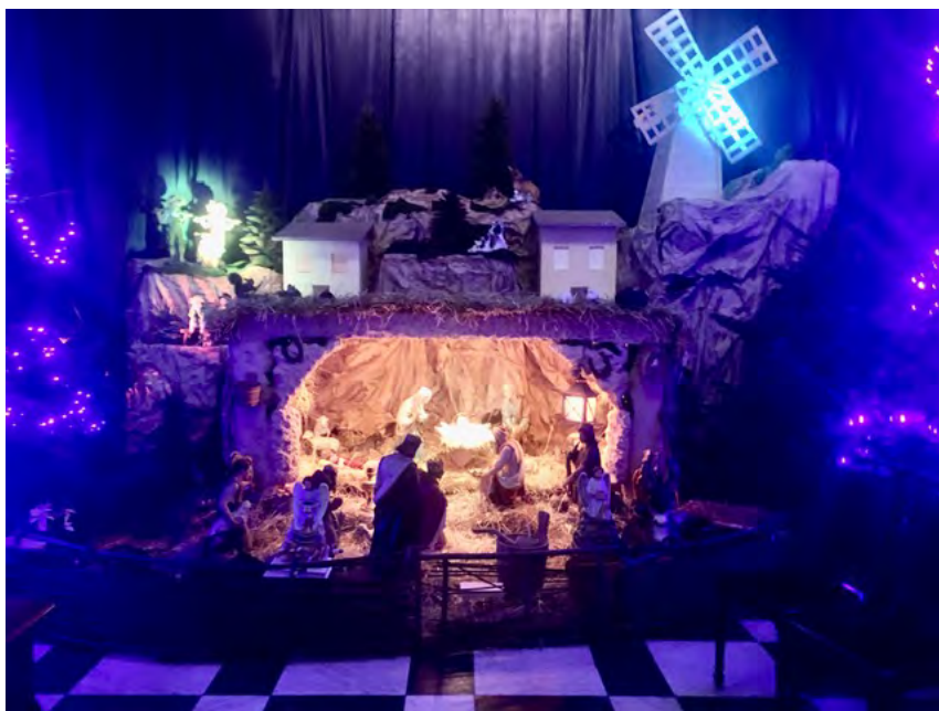
Tegoroczna Szopka Wilanowska