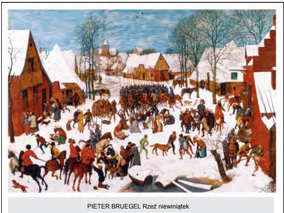
PIETER BRUEGEL Rzeź niewiniątek

https://niezbednik.niedziela.pl/artykul/215/Swieto-Swietych-Mlodziankow