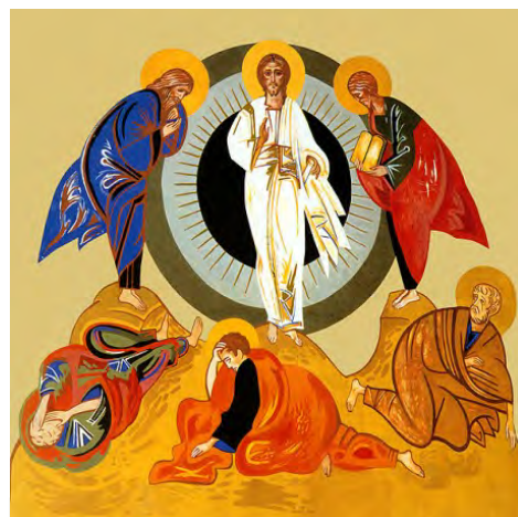
Przemienienie – ikona autorstwa Kiko Aurgeullo – ikona jest fragmentem Korony Misteryjnej.

Jeszcze jedno światło bije z Góry Tabor, szczególnie dla ludzi młodych. Chrześcijaństwo to pewien rodzaj alpinizmu; to wspinanie się na górę, na spotkanie z Panem i mozolne schodzenie w dół, na ten padół płaczu, by służyć braciom.