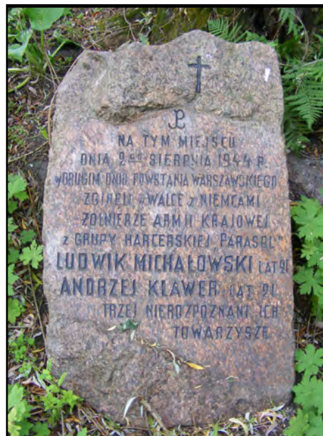
Kamień z mogiły powstańczej pod Wolicą