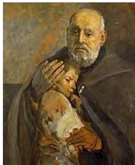
Leon Wyczółkowski, Brat Albert przytulający dziecko

W 1888 r. założył Zgromadzenie Braci Postępujących Ubogim. Od listopada 1888 r. podjął bezinteresowną opiekę nad miejską ogrzewalnią w Krakowie, gdzie stworzył przytulisko dla bezdomnych i kalek. Zamieszkał z nimi, stał się jednym z nich. Nadludzkiem wysiłkiem walczył z nędzą, starając się zapewnić chleb, dla swoich podopiecznych na każdy dzień. Zachęcał do ufności mówiąc: Wszystkie sprawy zdawać na Opatrzność Boską, która obmyśla i najdrobniejsze szczegóły; Wszystko małe i wielkie zdawać na Opatrzność Boską z całym zaufaniem i pewnością.