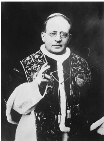
P. XI, papież w okresie od 6 lutego 1922 do 10 lutego 1939

Papież Pius XI w ustanowionym święcie widział dla Kościoła lekarstwo przeciw zarazie zeświecczenia, czyli laicyzmu, który stopniowo dojrzewał w społeczeństwie. Zaczęło się bowiem od tego, że przeczono panowaniu Chrystusa Pana nad wszystkimi narodami; odmawiano Kościołowi władzy nauczania ludzi, wydawania praw, rządzenia narodami, którą to władzę otrzymał Kościół od Chrystusa Pana, aby prowadził ludzi do szczęścia wiekuistego. I wtedy to zaczęto powoli zrównywać religię Chrystusową z innymi religiami fałszywymi i stawiać ją bezczelnie w tym samym rzędzie; następnie podporządkowano ją pod władzę świecką i wydano ją prawie na samowolę rządu i panujących; dalej jeszcze poszli ci, którzy umyśliłi sobie, że należy zastąpić religię Bożą jakowąś religią naturalną, naturalnym jakimś wewnętrznym odruchem. A nie brakło i państw, które sądziły, że mogą się obejść bez Boga i że ich religią to – bezbożność i lekceważenie Boga . Po ponad dziewięćdziesięciu latach, które upłynęły od napisania tych słów, laicyzm nie tylko utrwalił swoje zdobycze, ale bezwzględnie wciąż podporządkowuje sobie nowe obszary życia poszczególnych ludzi i społeczeństw.