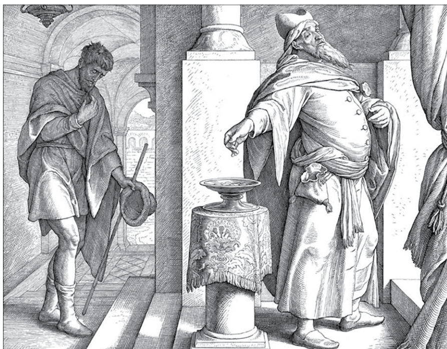
Faryzeusz i celnik, Schnorr von Carolsfeld, Biblia w obrazach, 1860