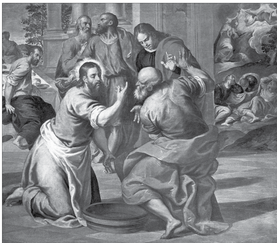
Umycie nóg, Giovane Palma, 1591