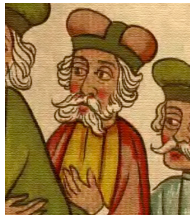
Janusz I Starszy – podobizna z XV-wiecznego rękopisu