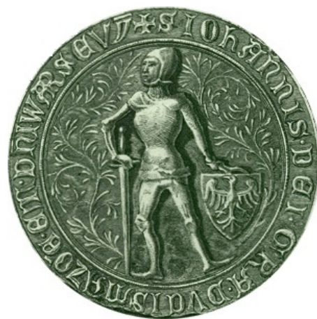
Napis na pieczęci brzmi: „Pieczęć Janusza z Bożej łaski księcia Mazowsza i pana Warszawy”

W 1580 r. właściciele gruntów milanowskich płacili podatek od 9 i ¼ włóki osiadłej.