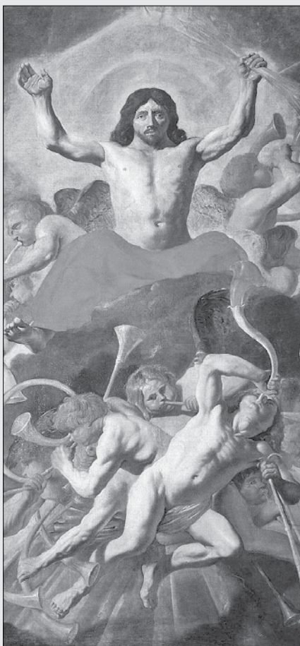
Sąd Ostateczny, Bernard van Orley, ok. 1542 r.