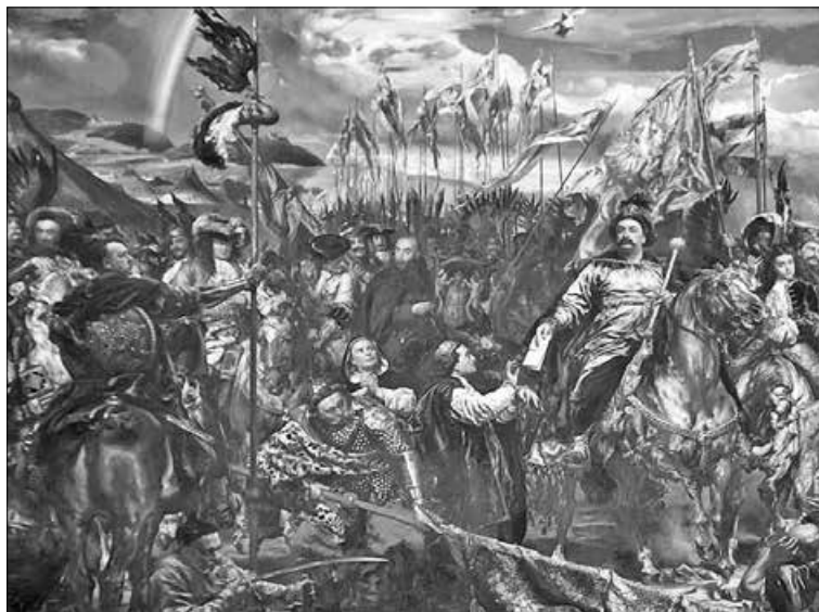
Jan Matejko, Sobieski pod Wiedniem (fragment)

Kiedy na zachodzie Europy islamscy Turcy rozpoczęli inwazję na kraje chrześcijańskie, a ich zwycięstwo przeważało i zagrażało już Austrii, papież Innocenty XI zwrócił się o pomoc zbrojną do Jana III Sobieskiego, by ratował chrześcijaństwo. Jednak sejm polski, mając na uwadze pusty skarb i wyczerpany wojnami kraj, wahał się... Wtedy to szaleńczo przechylał świętobliwy o. Stanisław Papczyński (dziś błogosławiony), spowiednik króla, założyciel Zgromadzenia Ojców Marianów, którego hasło życia brzmiało: Immaculata Virginis Conceptio sit nobis salus et protectio – Niepokalane Poczęcie Maryi niech będzie nam zbawieniem i obroną.