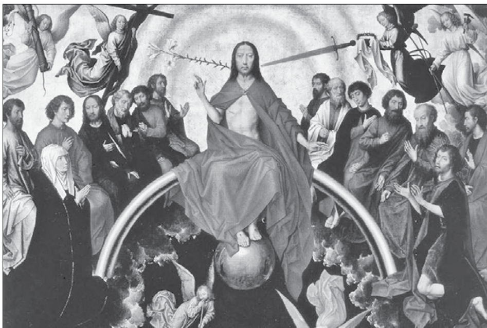
Sąd Ostateczny (fragment) – tryptyk malarza niderlandzkiego, Hansa Memlinga, stworzony między 1467 a 1471 rokiem. Obraz w zbiorach Muzeum Narodowego w Gdańsku.