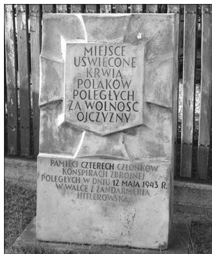
Obelisk na Kępie Latoszkowej

► od którego wszystkie nieszczęścia się zaczęły. Jednak AK-owski wywiad robił swoje. Jak wspominali świadkowie tamtych wydarzeń, kilka miesięcy później żołnierze podziemia dostali cynk, że poszukiwany będzie jechał wozem do Warszawy, ukryty pod skrzynkami z warzywami. Wóz zatrzymano w Wilanowie, wyciągnięto z niego zbiega i na miejscu wymierzono mu karę śmierci. Polska, chociaż znajdowała się pod okupacją, potrafiła karać zdrajców. Pamiętajmy również o tym, że koloniści, choć pochodzenia niemieckiego, byli obywatelami polskimi.