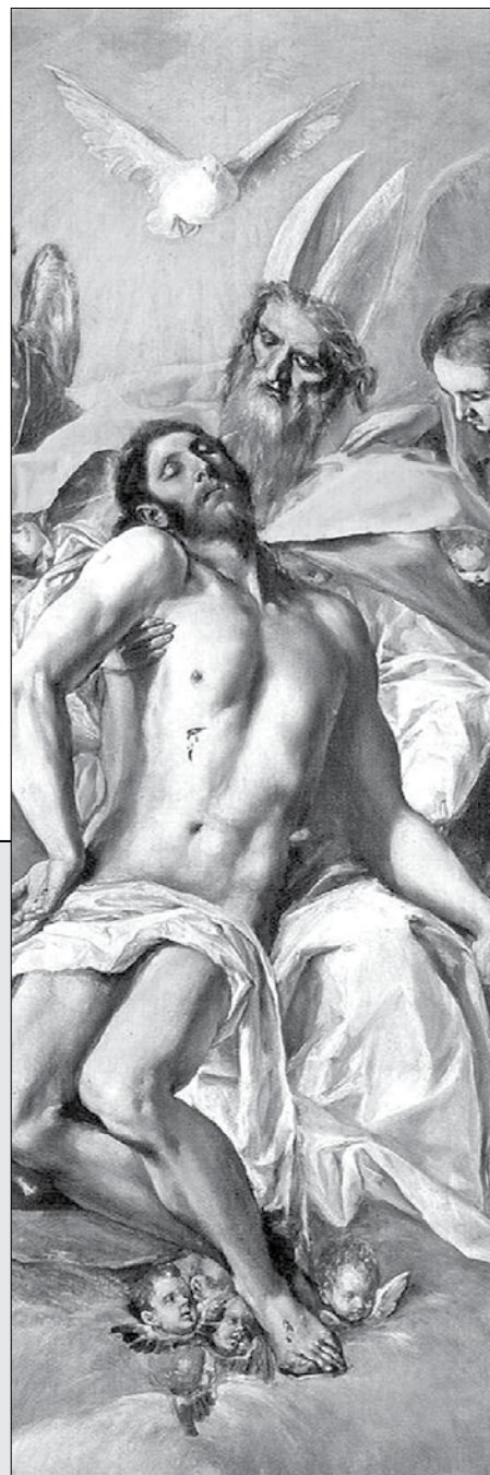
Trójca Przenajświętsza, El Greco, 1578, Muzeum del Prado, Madryt

Św. Tomasz a Kempis napisał w książce pt.: „O naśladowaniu Chrystusa”: „Wielu idzie za Chrystusem do momentu łamania chleba, lecz niewiele pozostaje do kielicha gorzkości”. Tymczasem nie ma chrześcijaństwa bez krzyża, tak jak nie ma Chrystusa bez krzyża.