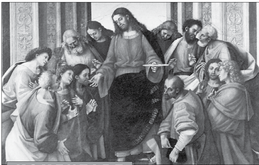
Luca Signorelli, Komunia Apostołów, 1512