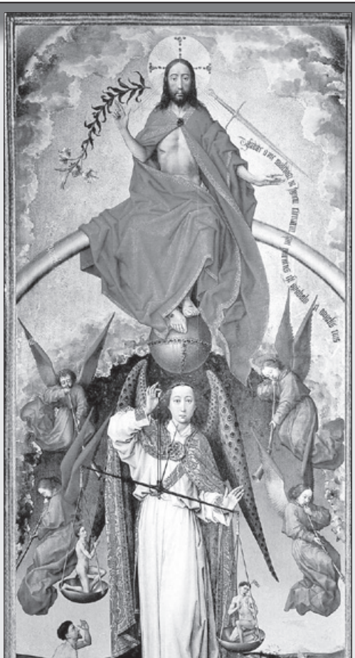
Sąd Ostateczny - Rogier van der Weyden, 1450