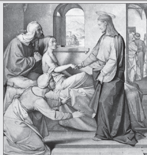
Wskrzeszenie córki Jaira - Friedrich Overbeck, 1815