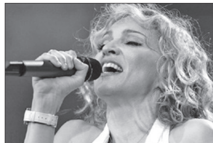
Gwiazda pop - Madonna