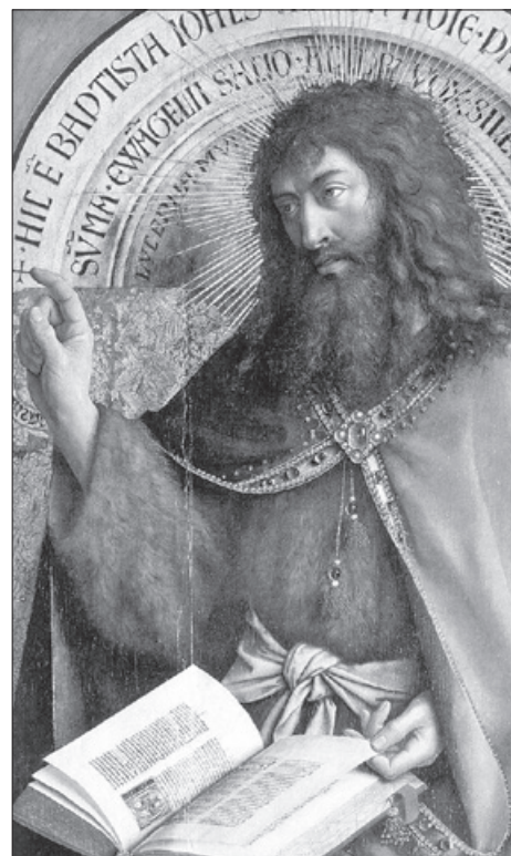
Katedra w Gent, fragment ołtarza, Święty Jan Chrzciciel, ok.1425