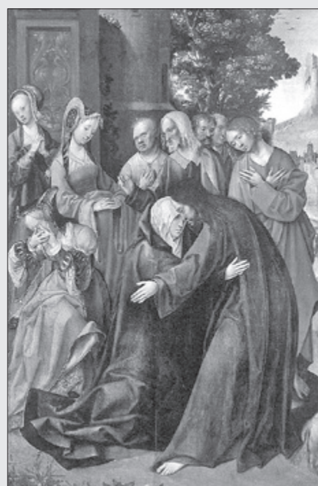
Chrystus żegnający się z Matką, Cornelis Engebrectsz, 1515.