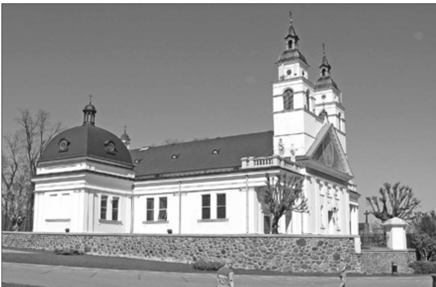
Kościół pw. św. Antoniego Padewskiego w Sokółce

W Wielki Czwartek, 9 kwietnia 2009 r., decyzją Jego Ekscelencji, kościół pw. św. Antoniego Padewskiego w Sokółce został podniesiony do rangi kolegiaty oraz powołano Kolegiacką Kapitułę Najświętszego Sakramentu. W jej skład weszli kapłani archidiecezji białostockiej – proboszczowie i budowniczy nowych kościołów. Charyzmatem Kapituły jest troska o kult i szerzenie czci Chrystusa Eucharystycznego – strzeżenie Eucharystii.