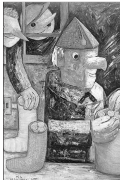
Tadeusz Makowski „Skąpiec”, 1932, olej na płótnie, Muzeum Narodowe, Warszawa

Zawyczaj mądrze jest nie umieszczać wszystkich pieniędzy w jednej inwestycji: „Rozdaj część między siedmiu czy nawet ośmiu, bo nie wiesz, co może się złego przydarzyć na ziemi” (Koh 11,2). Każda inwestycja wiąże się z ryzykiem, a Pismo Święte nie przedkłada określonego rodzaju inwestycji nad inne. Pismo Święte nie zabrania wprost hazardu, jednak wiele osób, które oddają się hazardowi, robi to w celu szybkiego wzbogacenia się. A to jest sprzeczne z Pismem Świętym. „Człowiek zazdrosny szybko chce dojść do bogactwa, a nie wie, że spadnie nań niedostatek” (Prz 28,22). Dlatego nie powinniśmy wystawiać się na ryzyko uzależnienia się od hazardu, ani nie powinniśmy wspierać branży, który zniewala tak wielu ludzi.