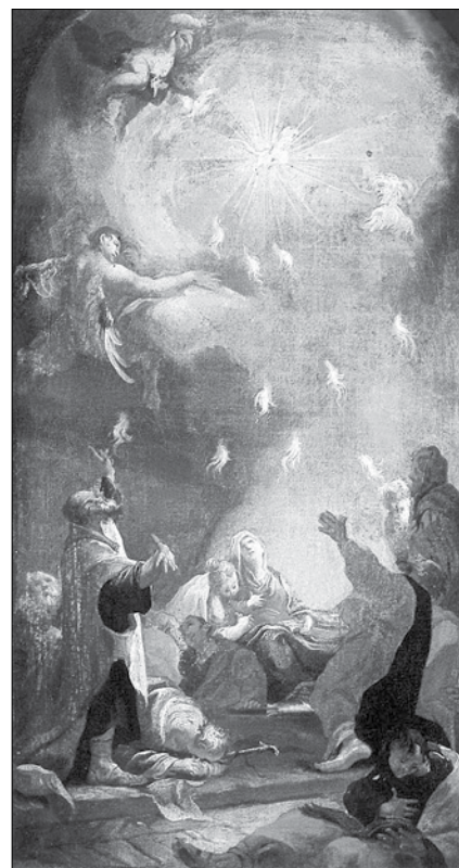
„Zesłanie Ducha Świętego” - Joseph Ignaz Miliorfer, 1750.