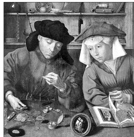
Lichwiarz i jego żona (fragment) Quentin Massys, 1514, Luwr

Wiele osób zaciąga długi zakładając pozytywną przyszłość tzn. ma przekonanie, że w przyszłości osiągnie wystarczające dochody, aby spłacić dług. Pismo Święte zniechęca do czynienia takich założeń : „Teraz wy, którzy mówicie: Dziś albo jutro udamy się do tego oto miasta i spędzimy tam rok, będziemy uprawiać handel i osiągniemy zyski, wy, którzy nie wiecie nawet, co jutro będzie... zamiast tego powinniście mówić: Jeżeli Pan zechce, i będziemy żyli, zrobimy to lub owo” (Jk 4,13-15).