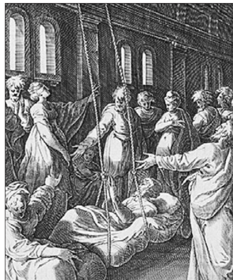
Claes Jansz Visscher Starszy grafik holenderski (1587-1652) „Chrystus uzdrawiający paralytyka”