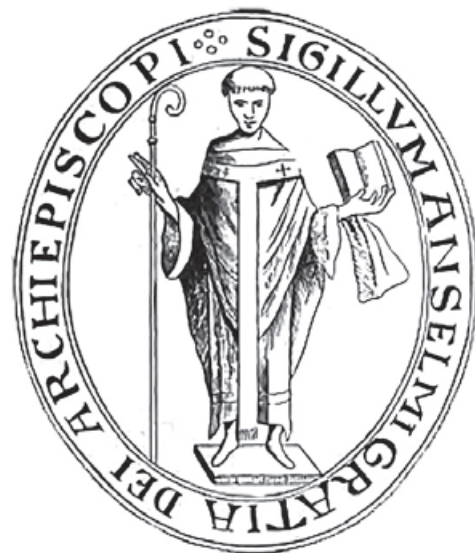
Pieczęć Anzelm z Canterbury

Kanonizowany w 1690 roku przez papieża Aleksandra VIII (kult od XIII w.), w 1720 r. ogłoszony przez Klemensa XI doktorem Kościoła.