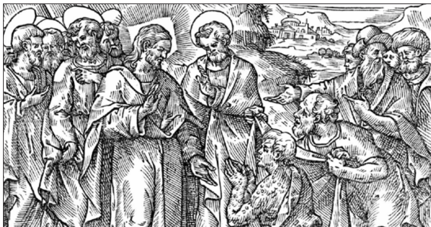
Giovanni Battista Raimondi, 1540-1630 Uzdrowienie trędowatego, drzeworyt.