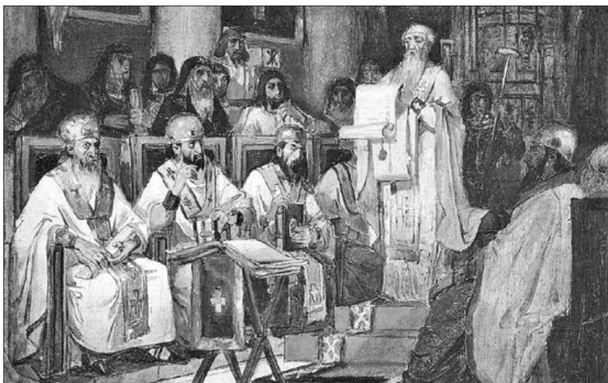
Sobór Nicejski II, obraz olejny V.I. Surikowa, 1876r.

Zasadnicze znaczenie dla rozstrzygnięcia sporu miał zwołany do Konstantynopola, a następnie przeniesio-