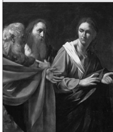
Jezus powołuje św. Piotra i Andrzeja - obraz Caravaggio, ok. roku 1590.