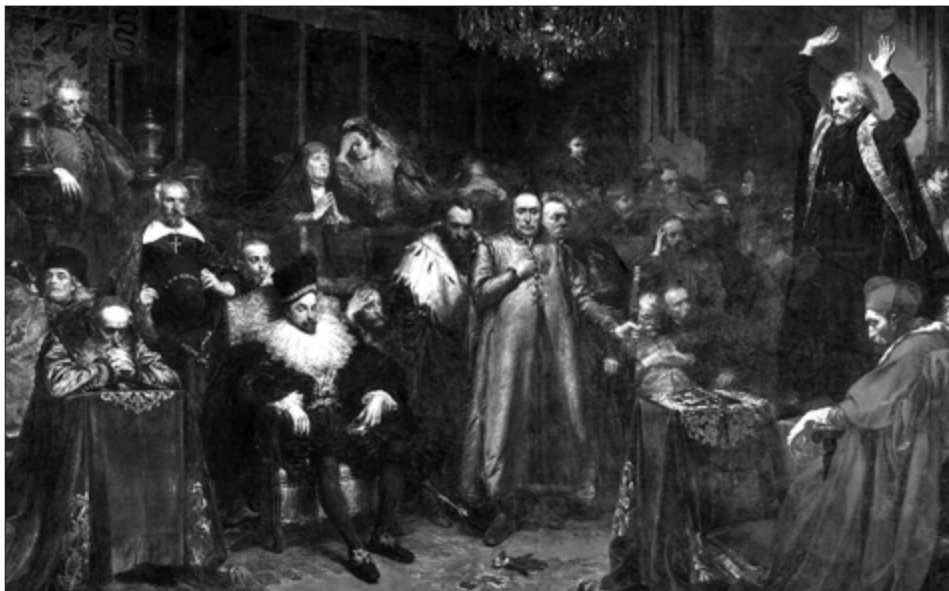
„Kazanie Skargi” - obraz Jana Matejki z roku 1864.