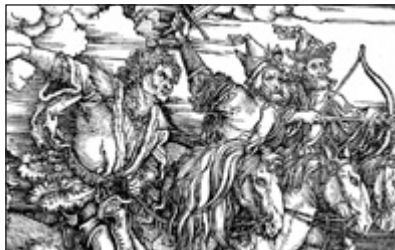
Jeźdźcy Apokalipsy Albrecht Dürer, 1497

Zbliżającą się apokalipsę zapowiadają też kataklizmy na Bliskim Wschodzie, masowe zwolnienia i wyzysk pracowników oraz pojawienie się fałszywych proroków. – Izajasz mówi o bezbożnikach cieszących się zdoby-