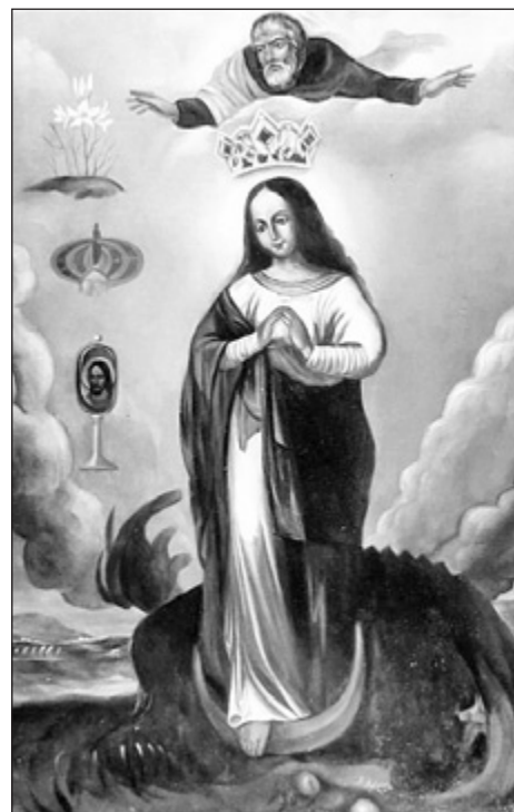
Matka Boża Tartakowska

Lubaczów, choć jest niedużym, kilkunastotysięcznym miastem, to tradycje związane z Lwowem i kresami południowo-wschodnimi wzięły na swoje barki i skutecznie przeniósł przez cały okres władzy komunistycznej w PRL. Zostając, po zmianach granic, stolicą archidiecezji lwowskiej, stał się miejscem, gdzie odbywały się wydarzenia