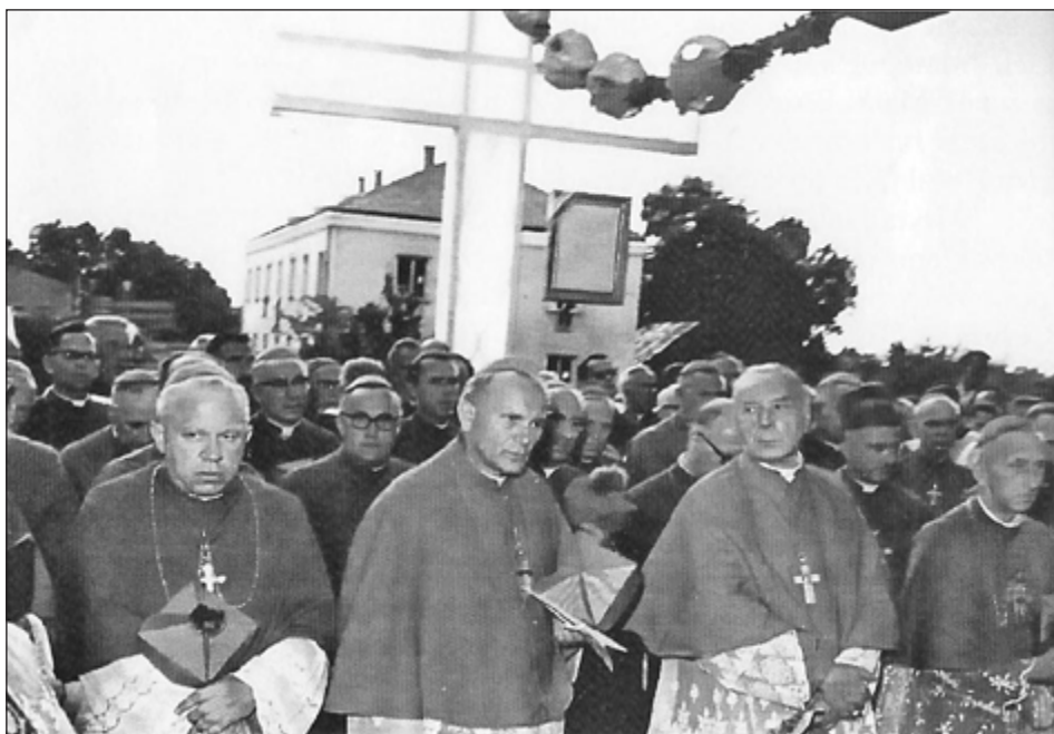
Lipiec 1971 rok.

i uroczystości o znaczeniu ponadlokalnym, jak w 1958 r., gdy obchodzono ćwierćwiecze sakry biskupiej metropolity lwowskiego abp. Eugeniusza Baziaka. W tym niedużym mieście, wówczas mieście symbolu, odbywały się również uroczystości o znaczeniu ogólnopolskim, związane z milenium chrztu Polski. Lubaczów gościł wówczas Episkopat Polski z prymasem Stefanem Wyszyńskim i abp. Karolem Wojtyłą na czele. ▶