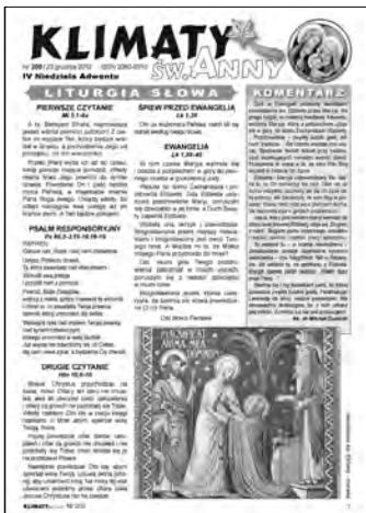
„Klimaty św. Anny” nr 200 23 grudnia 2012