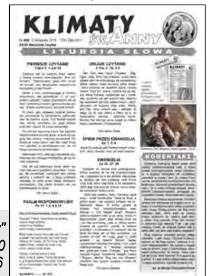
„Klimaty św. Anny” nr 400 6 listopada 2016

Przygotowując kolejne numery Klimatów modłę się do Ducha Świętego, aby podpowiadał co warto publikować, przeglądam kalendarz historyczny i liturgiczny, czytam informacje zamieszczane na chrześcijańskich portalach internetowych i do środy czekam na artykuły od parafian. We czwartek otrzymuję ogłoszenia parafialne i kończę skład numeru. Ostatnim etapem jest korekta. Po niej numer jest gotowy do druku i do zamieszczenia na parafialnej stronie internetowej, na parafialnym profilu Facebook oraz w Repozytorium Cyfrowym Biblioteki Narodowej.