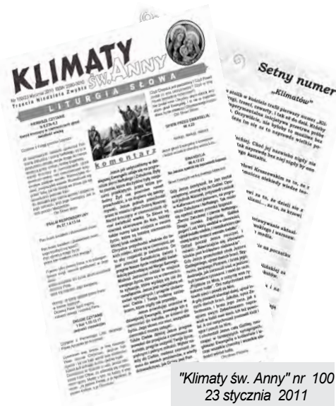
"Klimaty św. Anny" nr 100 23 stycznia 2011

W kolejnych numerach „Klimatów św. Anny” ukazywały się kilkuodcinkowe cykle artykułów np. „Klasztor w Polsce”, w poszukiwaniu których państwo Kruszewscy szturmowali bibliotekę. Syn państwa Kruszewskich, Jurek z własnej inicjatywy opracowywał „Historię papieństwa”, cykl artykułów o kolejnych papieżach.