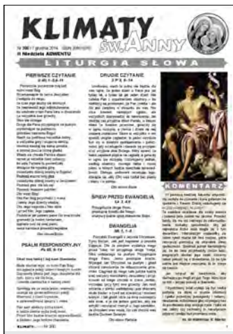
„Klimaty św. Anny” nr 300 7 grudnia 2014