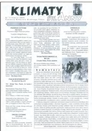
"Klimaty św. Anny" nr 1 1 marca 2009

W pierwszym numerze „Klimatów św. Anny” Ks. Proboszcz skierował do Czytelników następujące słowa: