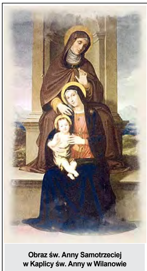
Obraz św. Anny Samotrzeciej w Kaplicy św. Anny w Wilanowie

3. Święta Anno, Anno Święta, Miłość to jest życia puenta, No więc.. życia się nie boję - Boską miłość mam za zbroję.