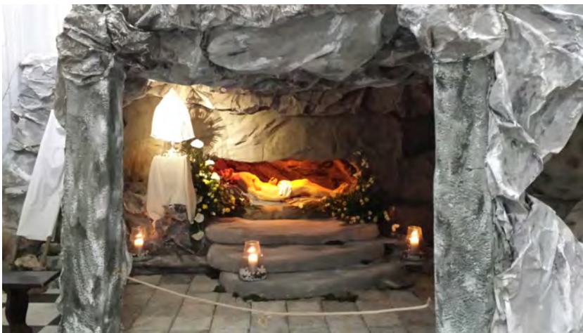
Grób Pański - Wielka Sobota 2018 rok