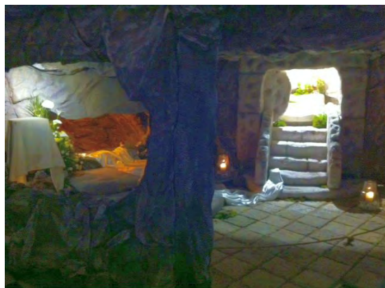
Pusty Grób - Niedziela Zmartwychwstania 2018 rok