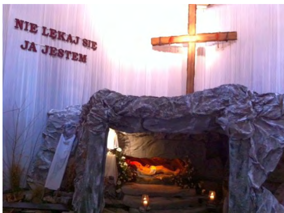
Grób Pański - Wielka Sobota 2018 rok